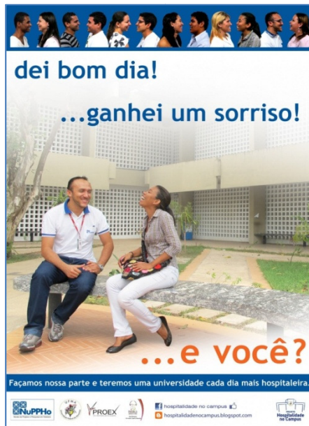
Figura 2 - Cartaz da Campanha.

com o apoio da PROEX com recursos financeiros para a confecção dos materiais impressos, da Rádio Universitária FM através de um spot , com 40 monitores selecionados exclusivamente para a Campanha.