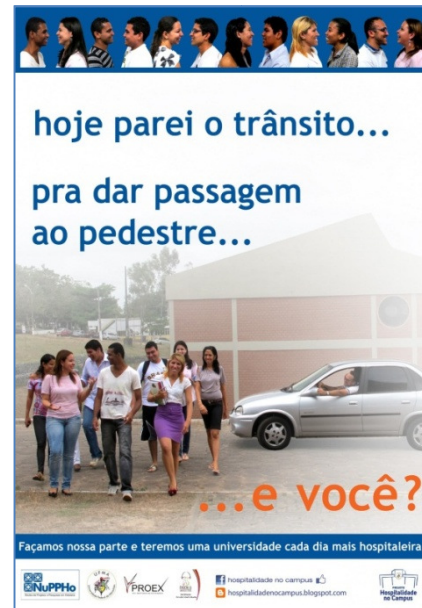
Figura 3 - Cartaz da Campanha.