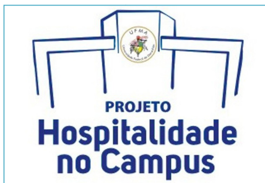
Figura 1 - Marca do Projeto Hospitalidade no Campus. Fonte: Andrade ( 2011, p. 5)

Para iniciar as atividades, o projeto precisava de uma identidade, logo elaboramos uma marca para o projeto. Com a participação de toda a equipe, chegamos à marca que remete ao novo pórtico de entrada da UFMA, para destacar que a hospitalidade na UFMA ser praticada desde a chegada (figura 1).